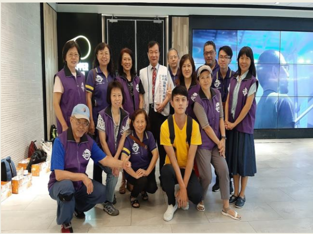
生命線微電影記者會(生命線總會)