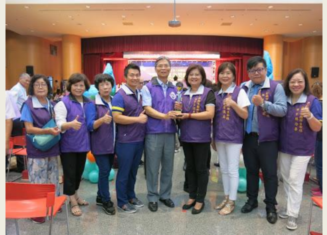
新北市政府社會局頒發領航金獎