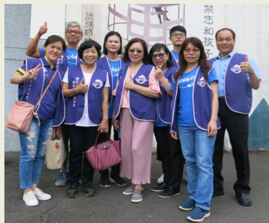
更生人出監前大團體輔導