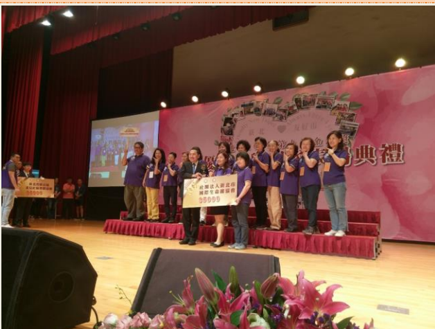
108年新北市績優志願服務工作團