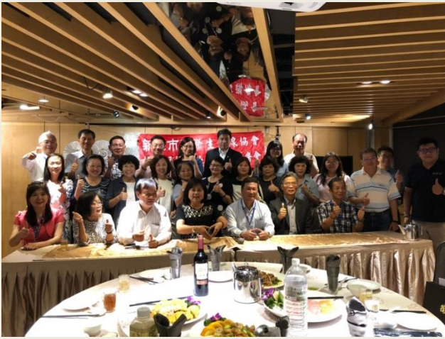
第 16 屆第 5 次理監事聯席會